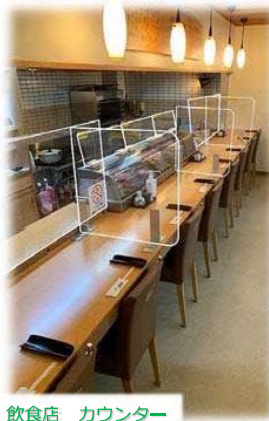
飲食店 カウンター