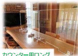
カウンター用ロング