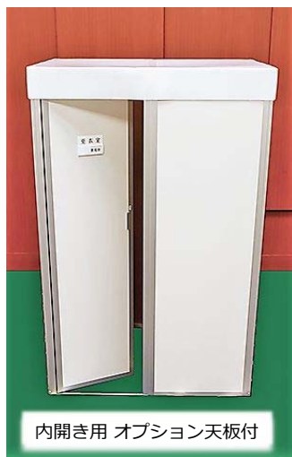
内開き用 オプション天板付