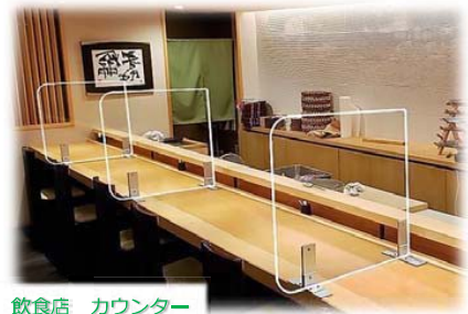
飲食店 カウンター