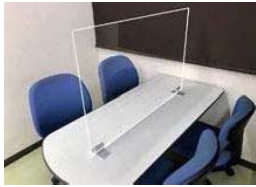
アクリル間仕切り (デスク用)

デスク用：幅900mm×高さ600mm 厚み3mm (窓口加工なし) 1枚あたり 7,000円 (税別)