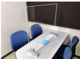
アクリル間仕切り (カウンター用)

デスク用：幅900mm×高さ600mm 厚み3mm (窓口加工あり) 1枚あたり 8,000円 (税別) ※窓口サイズ 幅300mm×高さ150mm