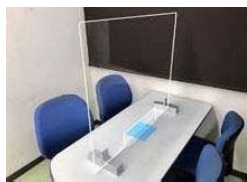
アクリル間仕切り (カウンター用)