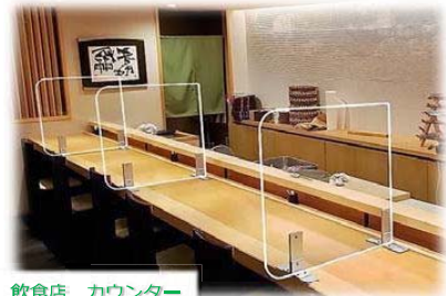
飲食店 カウンター

※地域によっては送料がかかる場合がございますのでお問い合わせください。 ※納品について、規格サイズはご注文から1週間～10日位となります