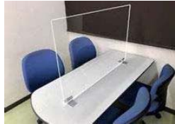
アクリル間仕切り (デスク用)