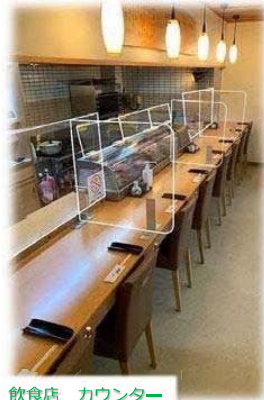
飲食店 カウンター