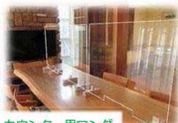
カウンター用ロング