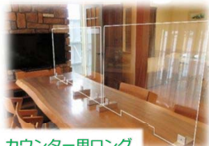
カウンター用ロング