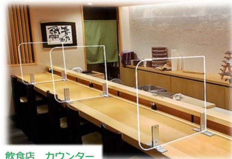
飲食店 カウンター