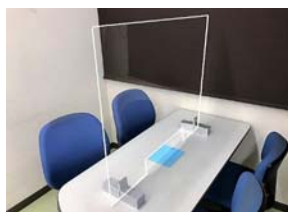
アクリル間仕切り (カウンター用)