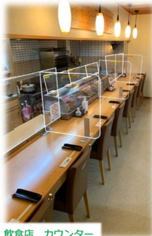
飲食店 カウンター