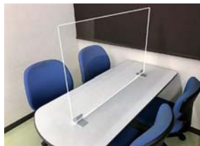
アクリル間仕切り (デスク用)